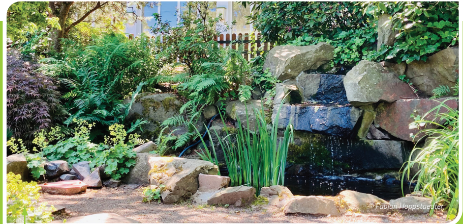
Blumengarten in Bexbach

Der Blumengarten Bexbach ist ganzjährig geöffnet und kostenfrei zugänglich. Seit 1949 ist er ein touristisches Juwel, das Besucher mit einer Vielfalt an Pflanzen begeistert. Beliebt ist besonders das jährliche Blumengartenfest am dritten Wochenende im Juni. Aber auch im Winter lädt der Blumengarten zum Spazieren und Verweilen ein. Im Wahrzeichen von Bexbach, dem